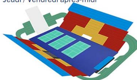
Jeudi / Vendredi après-midi

● Catégorie Or ● Catégorie 1 ● Catégorie 2 ● Catégorie 3