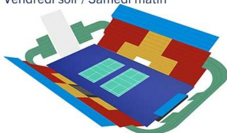
Vendredi soir / Samedi matin

● Catégorie Or ● Catégorie 1 ● Catégorie 2 ● Catégorie 3